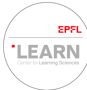
EPFL LEARN Center for Learning Sciences