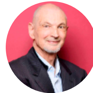
Serge Tisseron Psychiatre, membre de l'Académie des technologies française